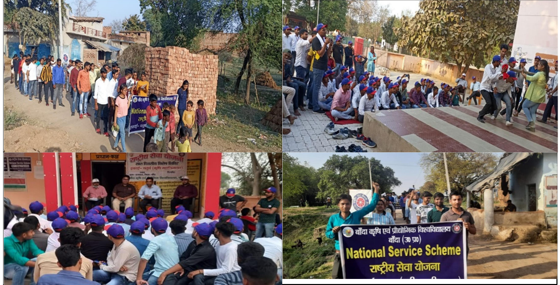
Daywise activities done by NSS volunteers of NSS Units during 7 days special camp (22<sup>nd</sup> - 29<sup>th</sup> March 2022 ) in adopted villege Tikari & Raghuwanspura