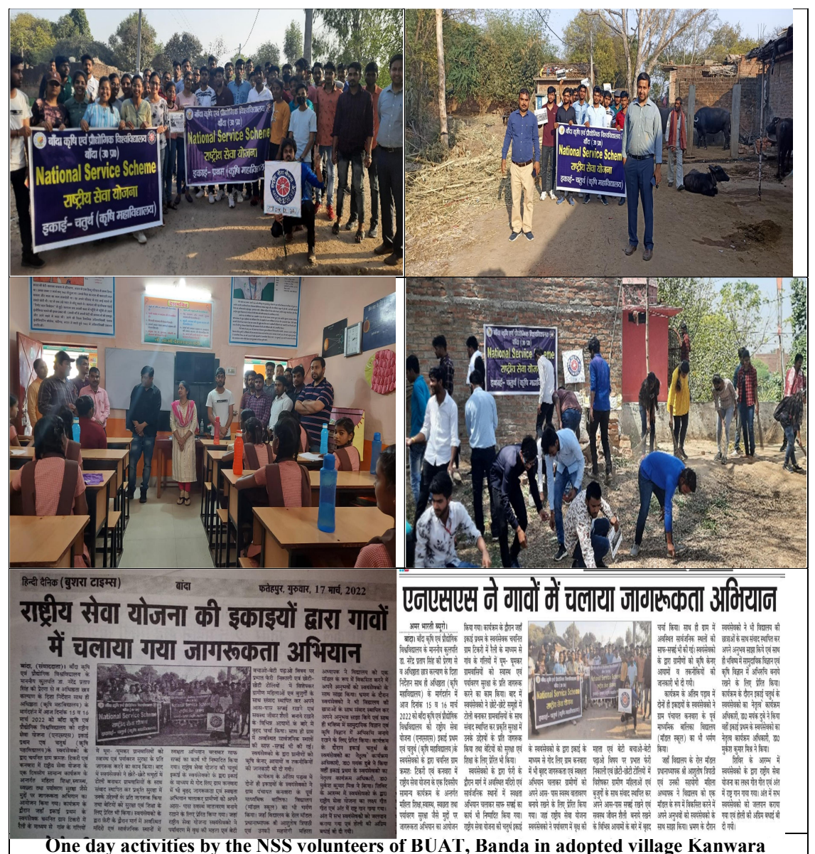
One day activities by the 1455 volunteers of Dentity Danda in adopted vinag