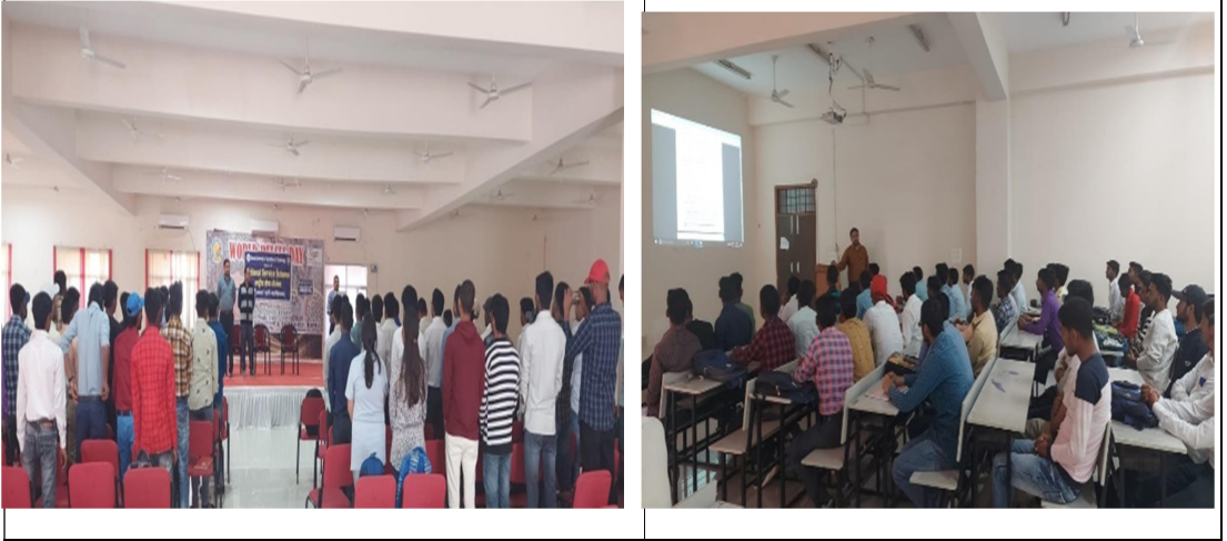
Orientation program of NSS Volunteers

Orientation program of newly admitted NSS Volunteers was organized.